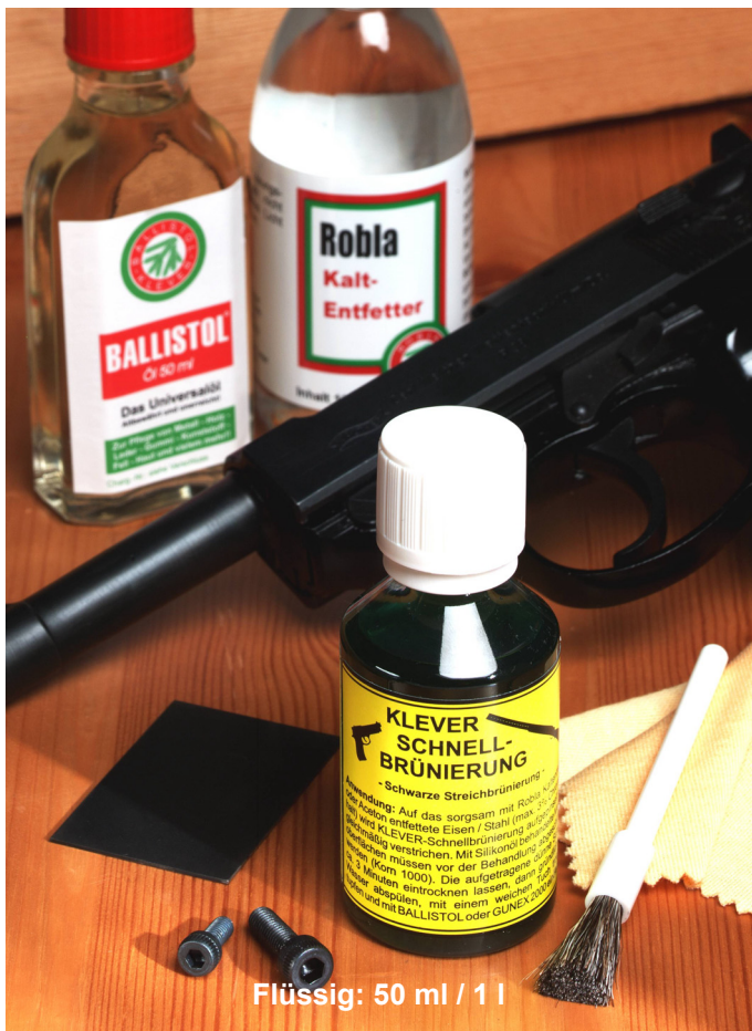
Flüssig: 50 ml / 1 l