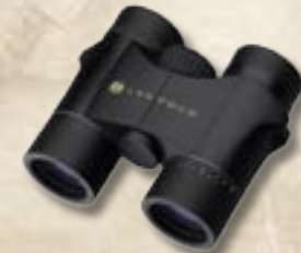
Katmai 6x32 8x32 10x32