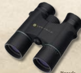
Pinnacle 8x42 10x42