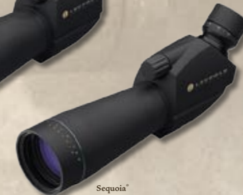
Sequoia® 15-45x60 Angled