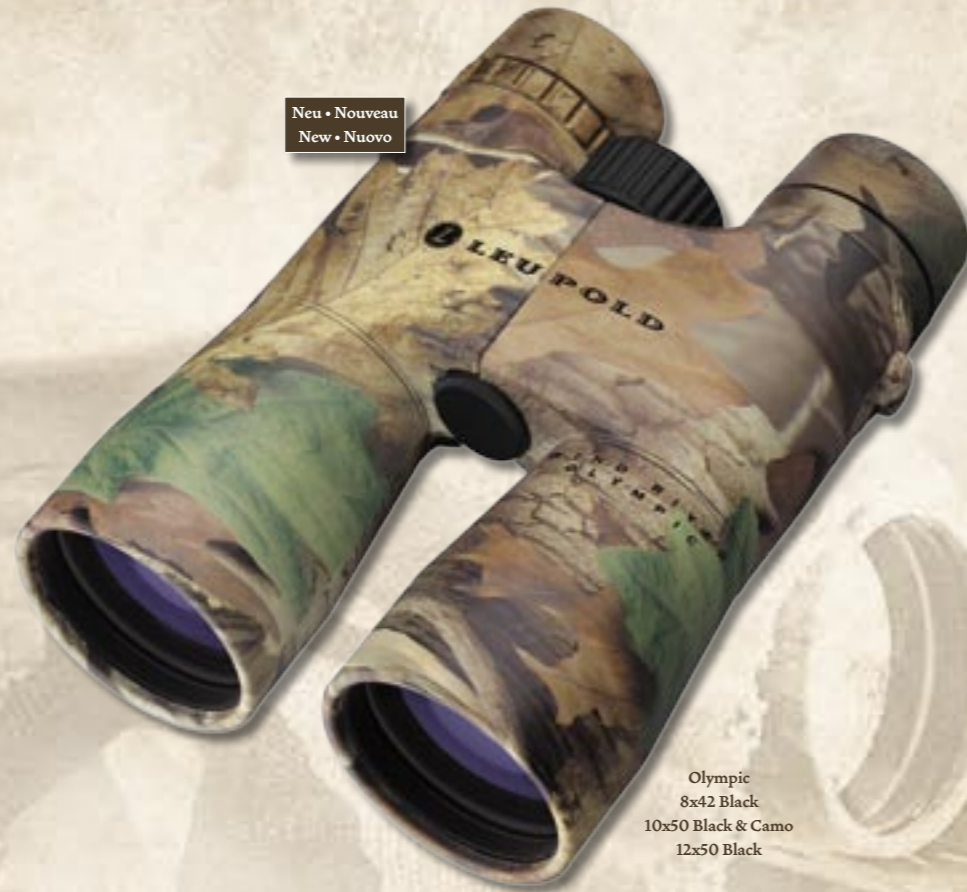
Olympic 8x42 Black 10x50 Black & Camo 12x50 Black

Les jumelles de la série Wind River offrent l'optique adaptée pour tous les besoins et ceci à un prix incroyablement bas. L'anneau vert garantit des images d'une netteté cristalline et une authenticité surprenante des couleurs. La gaine en caoutchouc rend les jumelles Wind River particulièrement ergonomiques et résistantes. La grande distance oculaire de ces poids plume est idéale même pour les porteurs de lunettes. Il va sans dire que tous les modèles Wind River sont étanches, anti-buées et adaptés aux environnements les plus rudes. Nos jumelles camouflées « Advantage Timber HD » s'intègrent parfaitement aux tenues de camouflage. Tous les modèles Wind River sont livrés avec une cache oculaire et des courroies de transport capitonnées.