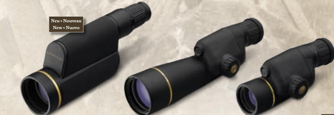
12-40x60 HD 12-40x60