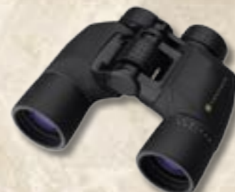
Mesa 8x42 Black & Camo 10x50 Black & Camo