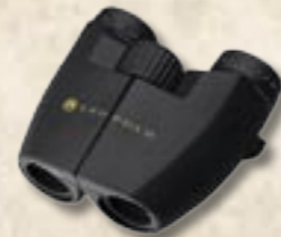
Mesa Compact 8x23 10x23