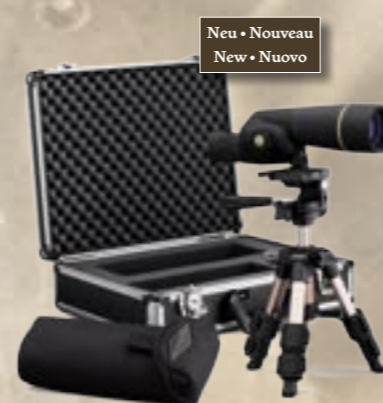
15-30x50 Compact Kit

Der neue Digitalkamera-Adapter ist auch separat erhältlich.