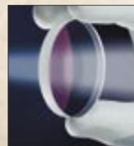
Index Matched Lens System

Les nouvelles jumelles Golden Ring de taille 8x42 et 10x42 sont l'outil de choix des chasseurs et observateurs de la nature, qui accordent la priorité première à une qualité fiable. Le système de lentilles repose sur le système novateur « Index Matched Lens » qui garantit un degré de transparence allant jusqu'à 98 %. Les prismes à haute réflexion à revêtement par phase livrent des images extrêmement précises et nettes. Les lunettes élégantes de couleur brun foncé sont destinées à l'utilisation dans des conditions extrêmes, par tous les temps. Leur design ergonomique et leur corps en caoutchouc qui tient très bien en main garantissent un excellent confort d'utilisation. Un détail particulièrement pratique est la fonction de blocage pour la distance pupillaire qui permet la fixation individuelle de l'écart entre les oculaires. Il n'est donc nul besoin d'ajuster et vous pouvez tenir les jumelles d'une main. Les œillillons dévissables et réglables sont également adaptés aux porteurs de lunettes. L'anneau doré certifie la robustesse extrême et l'étanchéité des jumelles. L'équipement standard comprend une sangle de cou en néoprène, des caches de protection de l'objectif et un dispositif de protection des oculaires monocorps.