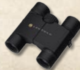
Olympic Compact 8x25 10x25