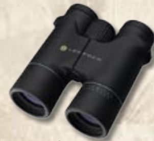
Cascades 8x42 Black & Camo 10x42 Black & Camo