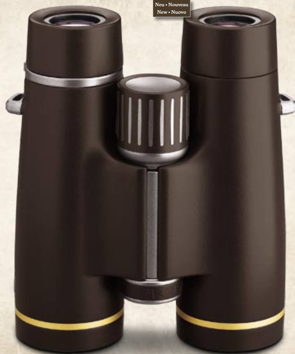
• 8x42 • 10x42