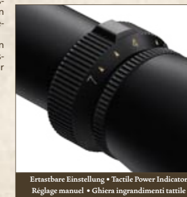
Ertastbare Einstellung • Tactile Power Indicator Réglage manuel • Ghiera ingrandimenti tattile

Il cannocchiale VX-II è uno dei nostri cannocchiali più venduti. Ciò dipende sia dall'eccellente qualità che dall'interessante prezzo. Tutti i modelli sono trattati con l'elaborato processo antiriflesso Multicoat 4 o , che favorisce la penetrazione di più luce nell'occhio, aumentando la prestazione alla penombra e minimizzando al contempo i riflessi di luce. Altre funzioni: la regolazione in altezza e laterale in „clic“ da 1/4 di minuto, il pratico oculare Fast Focus per la rapidissima messa a fuoco, come pure la regolazione dell'ingrandimento facilmente avvertibile al tatto, che permette al cacciatore di tenere di mira il bersaglio anche durante la modifica dell'ingrandimento. Il VX-II è apprezzato naturalmente per la struttura robusta e impermeabile all'acqua tipica di Leupold.