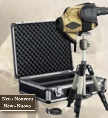
12-40x60 HD Kit