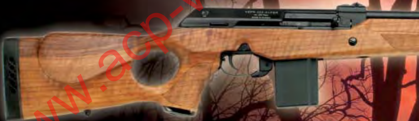
Linksschaft / left hand stock