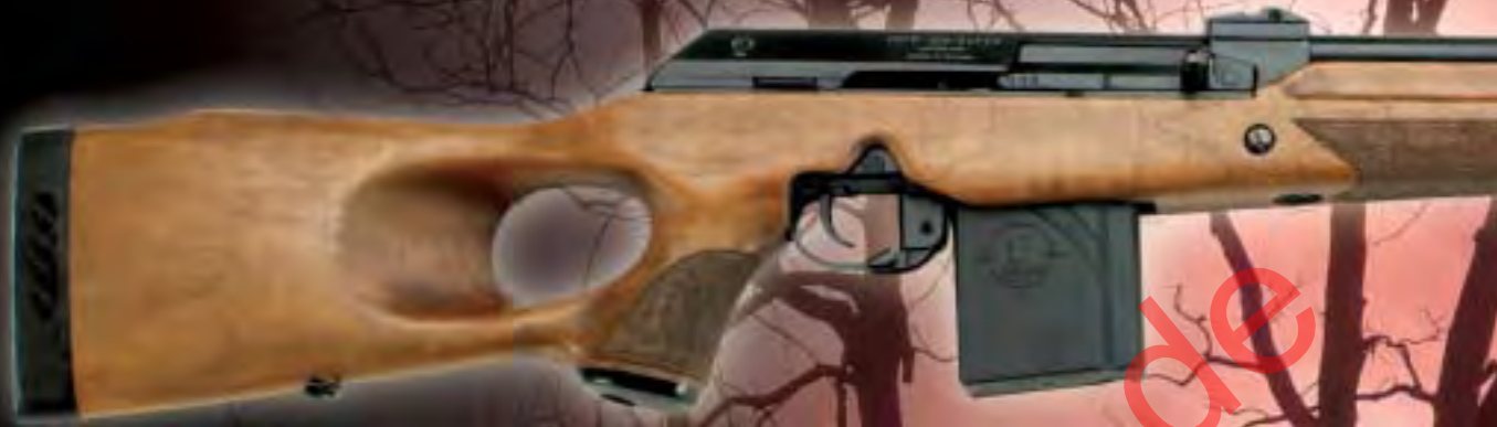
Rechtsschaft / right hand stock