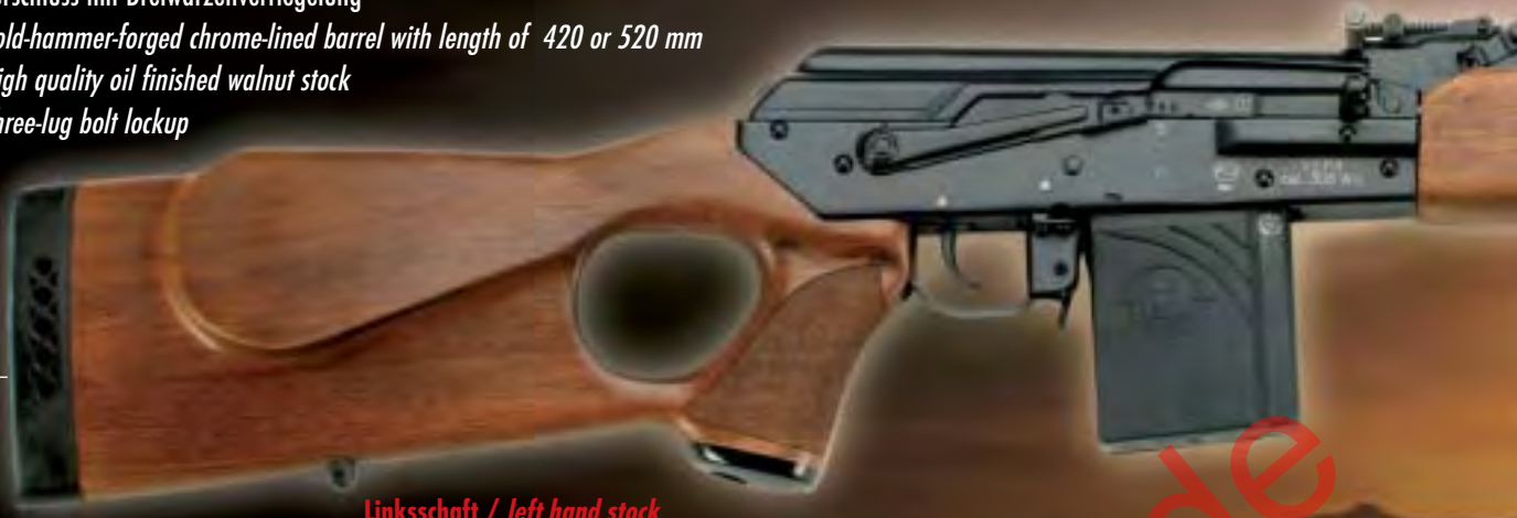
Linksschaft / left hand stock