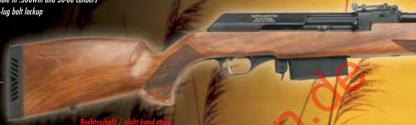
Rechtsschaft / right hand stock