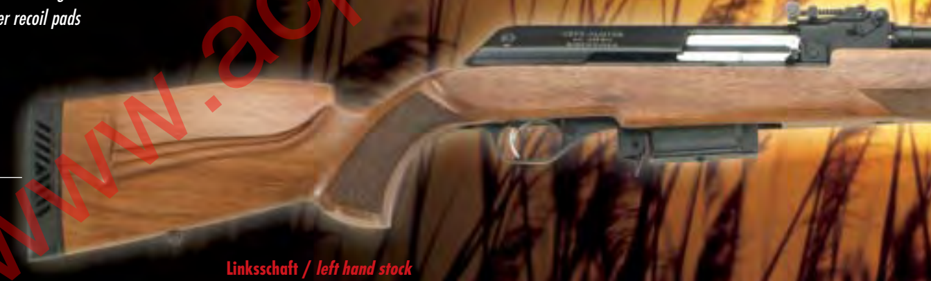
Linksschaft / left hand stock