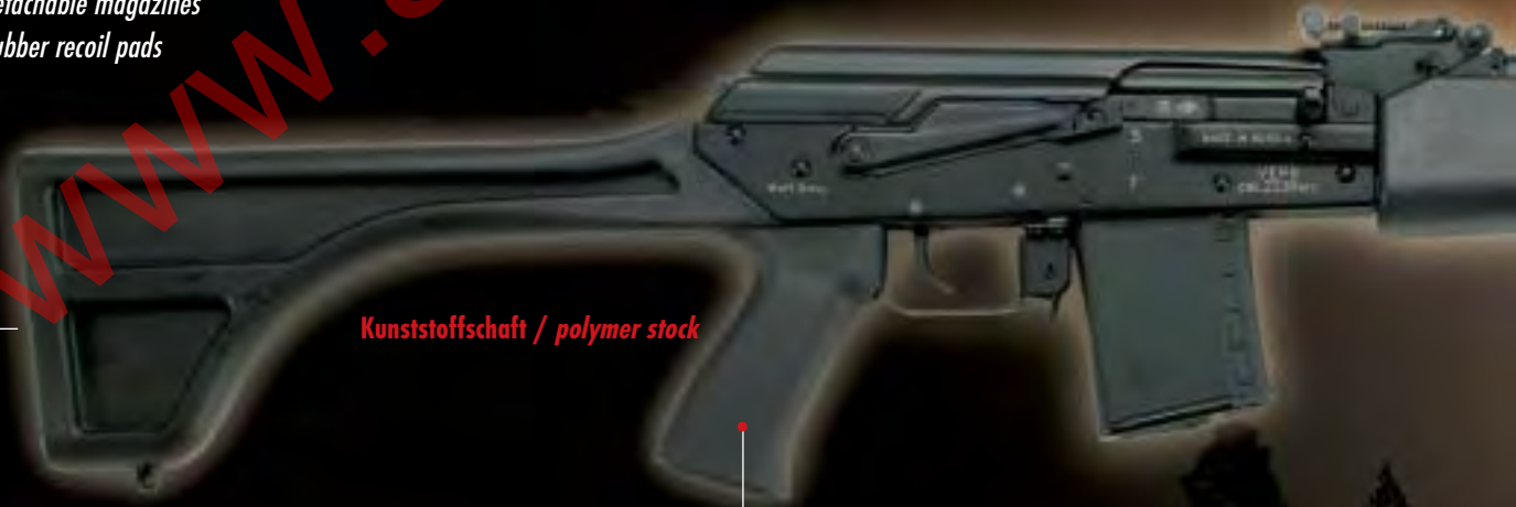
Kunststoffschaft / polymer stock