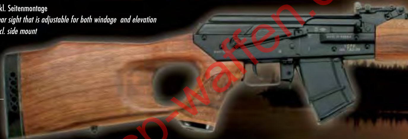
Rechtsschaft / right hand stock