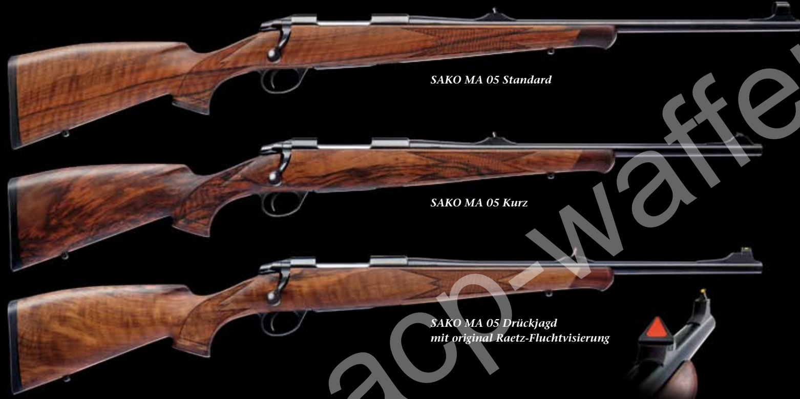
SAKO MA 05 Standard

Die serienmäßige konische Prismenschiene der SAKO MA 05 erlaubt die Aufnahme aller gängigen Montagetypen. Präzise und genial einfach lassen sich jedoch die original SAKO-Optik-Montagen mit Inlayringen aus Kunststoff einsetzen. Sie machen das Verkleben der Ringe überflüssig.